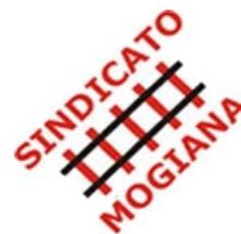
SINDICATO DOS TRABALHADORES EM EMPRESAS FERROVIÁRIAS DA ZONA MOGIANA