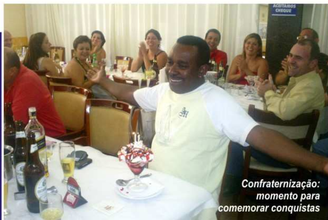
Confraternização: momento para comemorar conquistas

Como é de costume, foi oferecido para todos os hóspedes uma grande mesa de frutas e petiscos, com música ao vivo, abrilhantado pelo Maestro “Meio Quilo, lembrando grandes sucessos para dançar e curtir muito.