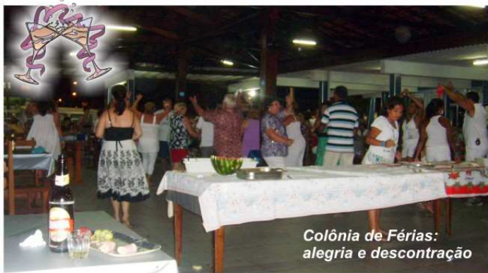
Colônia de Férias: alegria e descontração