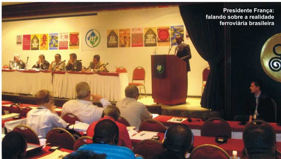
Presidente França: falando sobre a realidade ferroviária brasileira

Para o presidente da Paulista, a defesa da ferrovia como alter-