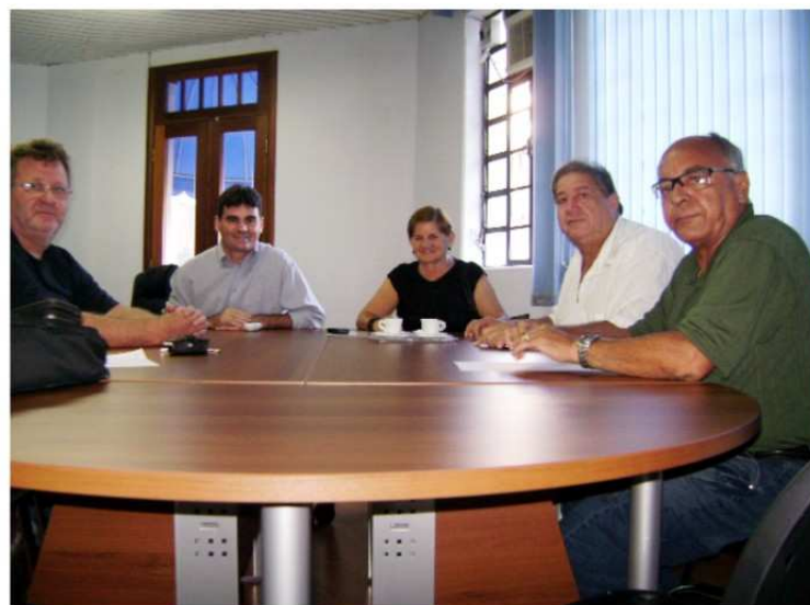
Diretores do Sindicato e autoridades de Rincão: parceria

Na oportunidade a prefeita deixou claro o interesse na renovação do contrato, pois com essa parceria a Prefeitura de Rincão mantém uma escolinha